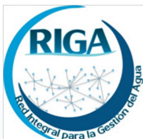
RIGA - Red Integral Para la Gestión del Agua