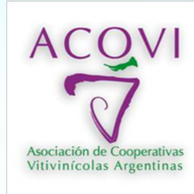
Asociación de Cooperativas Vitivinícolas Argentinas