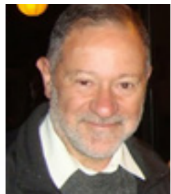
Luis Romito Bodegas de Argentina

Queremos expresar el apoyo institucional de VALOS a la Maestría en Responsabilidad Social y Desarrollo Sostenible de UNCUIYO. Consideramos un éxito el desarrollo de esta maestría que pondrá a Mendoza a la vanguardia en la formación académica en la materia, permitiendo formar más y mejores profesionales que promuevan y lleven adelante la responsabilidad social y el desarrollo sostenible desde empresas y organizaciones de la sociedad civil. Creemos que esta maestría da continuidad al trabajo iniciado por Valos en el año 2003, llevando a una nueva etapa el desarrollo académico de la RS y el DS y contribuyendo con ello a la misión de VALOS: Lograr una Mendoza sostenible. Celebramos el inicio de este nuevo camino y comprometemos nuestro apoyo y participación para asegurar su éxito y continuidad en el tiempo.